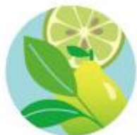
アールグレイティー