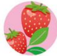
ストロベリーティー