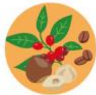
ヘーゼルナッツコーヒー