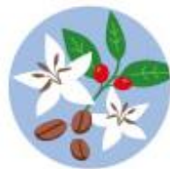
アラビカコーヒー